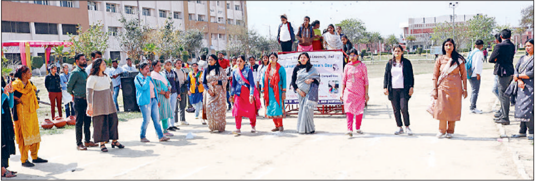
जीट। दौड़ प्रतियोगिता में भाग लेती प्राध्यापिकाएं।