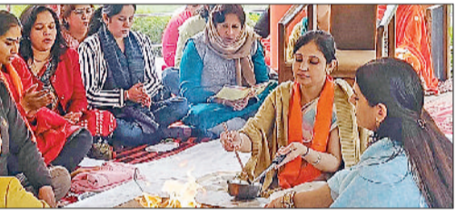
जीट। डीएवी स्कूल में यज्ञ में भाग लेते हुए।