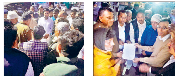
जींद। मृतक परिजनों से बातचीत कर उनका मांग पत्र लेते एसडीएम।