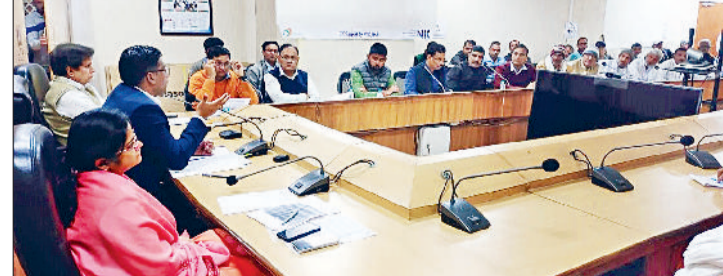
जींद। बैठक में आवश्यक दिशा निर्देश देती डीसी।