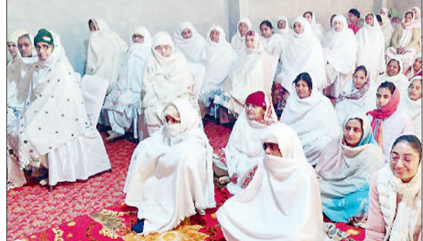
ब्रह्मा कुमारीज नरवाना सेवा केन्द्र पर आयोजित बैठक में उपस्थित श्रद्धालुगण।