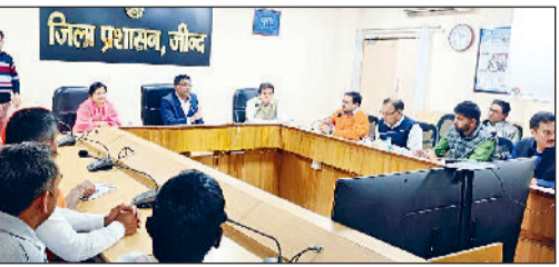
जीट। बैठक में दिशा-निर्देश देते डीसी।