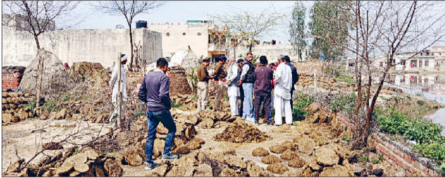
कलायत। कलायत के गांव बालू में उपलों के भंडारण के बीच निशानदेही की लाइन तलाशते अधिकारी व ग्रामीण।

पंजाब-हरियाणा उच्च न्यायालय के आदेश पर हटाने जाने है अवैध कब्जे हरिभूमि न्यूज ▶ कलायत