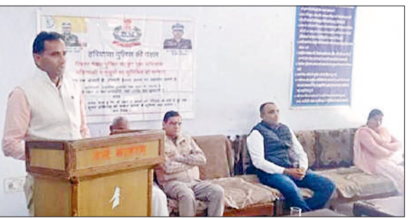
जीट। बच्चों को नशे के दुष्प्रभावों से अवगत करवाते वक्ता।