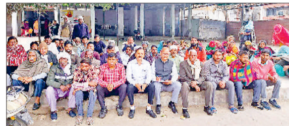
जींद। नागरिक अस्पताल में धरना देते मृतक परिजन।