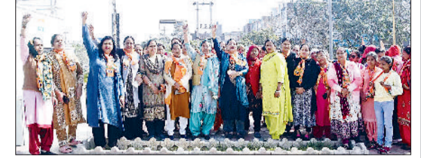
कैथल। नारी शक्ति वंदन यात्रा निकालती महिलाएं।