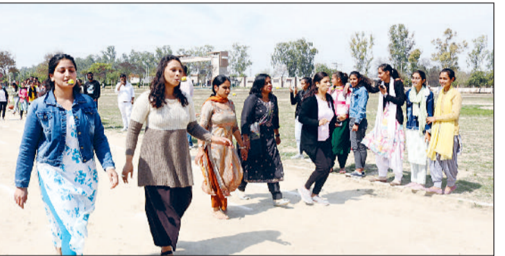
जीट। सीआरएसयू में आयोजित नींबू दौड़ में हिस्सा लेती प्राध्यापिकाएं।