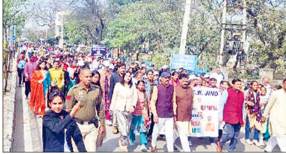
जींद। गोहाना रोड पर मैराथन में विधायक के साथ कदमताल करते हुए महिलाएं व छात्राएं।

यह कोई सामान्य कानून नहीं है। यह नए भारत की नई लोकतांत्रिक प्रतिबद्धता का उद्घोष है। ये अमृतकाल में सबका प्रयास से विकसित भारत के निर्माण की तरफ बहुत मजबूत कदम है। महिलाओं का जीवन स्तर सुधारने