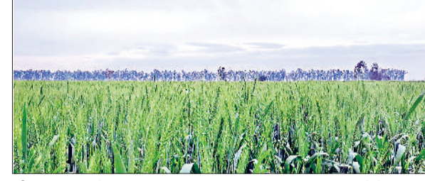
जींद। आसमान में छाप बादल।

मंगलवार दोपहर बाद आकाश में बादलों के छाने से फिर से किसानों की सांसें अटक रही। बूढ़ाबांदी के आसार भी बने रहे। जिसके साथ किसानों की धड़कनें भी उपर नीचे होती रही। किसानों को लगातार भय सताता रहा कि कहीं मौसम के बिगड़े, तैवर उनकी बची फसल को और चौपट न कर दे। मंगलवार को अधिकतम 22 व न्यूनतम तापमान आठ डिग्री दर्ज किया गया। मौसम में आद्रता 38% तथा हवा की गति 13 किलोमीटर प्रति घंटा दर्ज की गई। मौसम विभाग के अनुसार अगले 24 घंटों में मौसम शुष्क बना रहेगा। इस दौरान बादलवाड़ भी दिखाई देगी। मंगलवार को दिन का आगाज साफ मौसम तथा ठंड के साथ हुआ। दोपहर तक मौसम साफ बना रहा। हवा की गति भी मंद बनी रही।